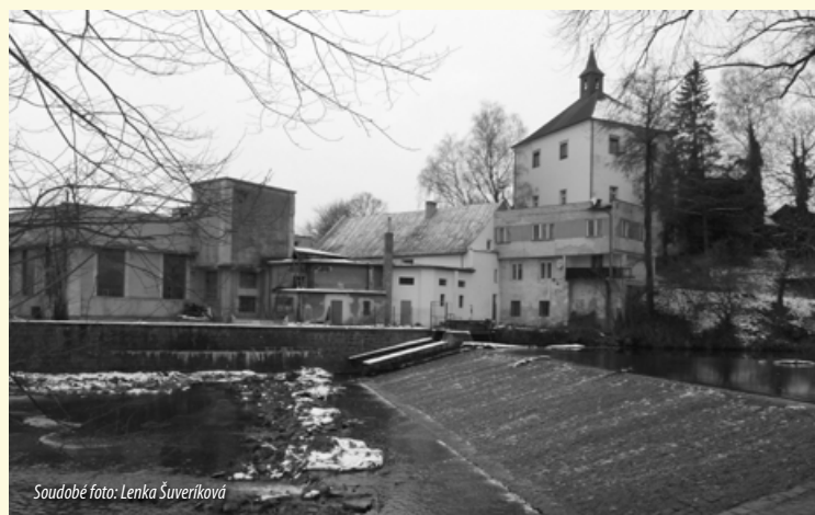
Soudobé foto: Lenka Šuveriková